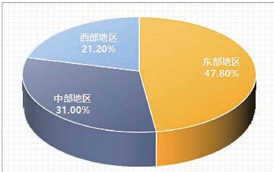
图1 500强合作社地区分布

从是否入选各级农民专业合作社示范社（简称“示范社”）情况看，500强合作社以国家级与省级示范社为主。500强合作社中有256家国家级示范社，占500强合作社的51.20%。国家级示范社中，东部地区共96家，占比为37.50%；中部地区共93家，占比为36.30%；西部地区共67家，占比为26.20%。从成立年限看，500强合作社平均成立年限为11年。